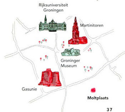
tekst Simon Cordes • illustratie Bas Duijst

Bronnen: pinkgron.nl biernet.nl/bier/brouwerijen/nederland/groningen/groningen/barbarossa